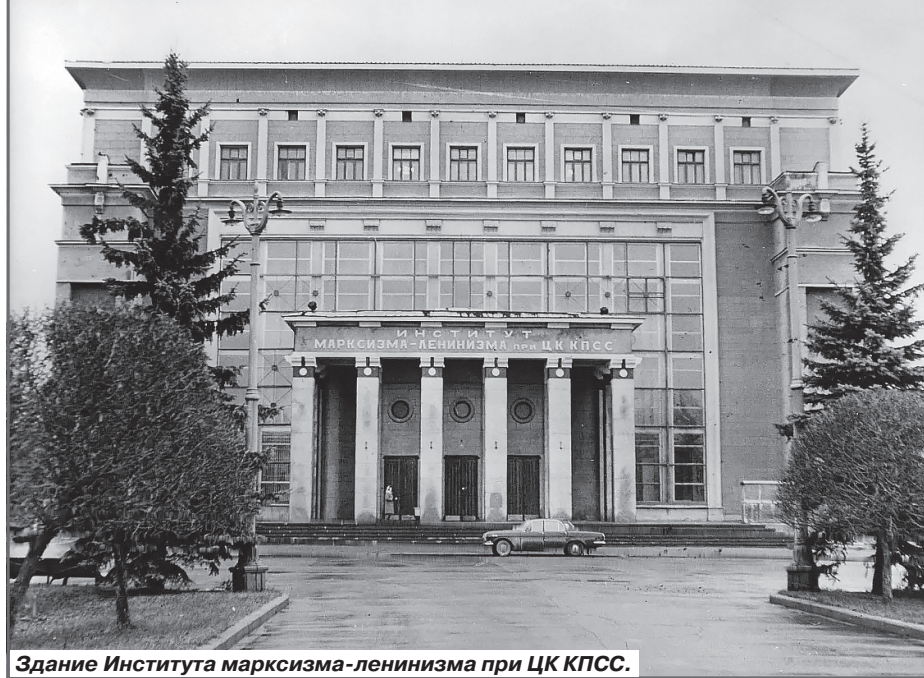
Здание Института марксизма-ленинизма при ЦК КПСС.

- Побудь здесь до конца обеда - не жалеешь. Я за тобой приду. И повернул в замке ключ. Комната до потолка была завалена связками книг. Автографы и дарственные надписи не оставляли сомнений - это была личная библиотека Ста-