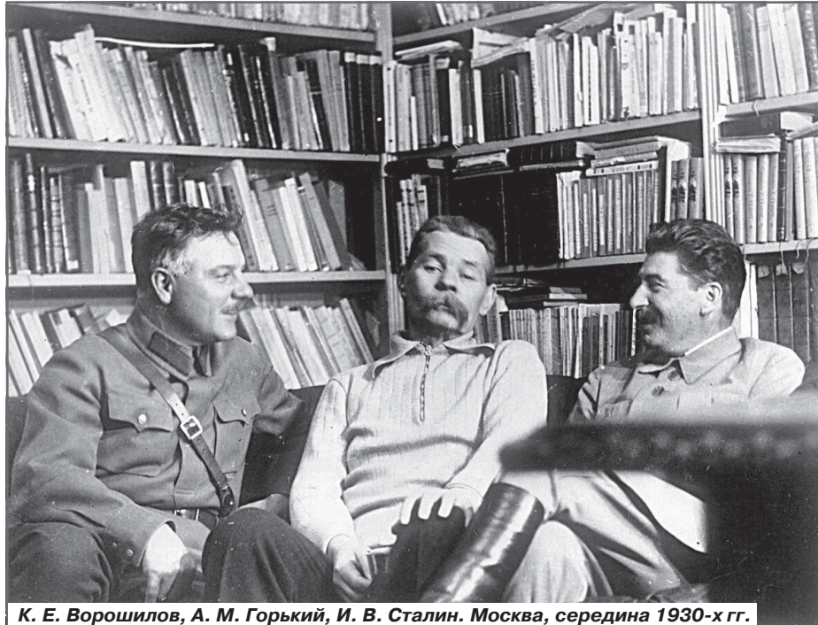
К. Е. Ворошилов, А. М. Горький, И. В. Сталин. Москва, середина 1930-х гг.

лина. В 1955 году наследники Сталина носились с идеей превратить его кабинет в музей. Дух Кобы еще долго витал под его сводами. Кабинет стоял опечатанный вплоть до 1962 года, когда он зачем-то понадобился Хрущеву. Больше всего хлопот при расчистке кабинета доставила именно библиотека. Значительную часть ее составляли книги, подаренные и подписанные авторами. Библиографическая ценность этой литературы дарственными надписями и ограничивалась.