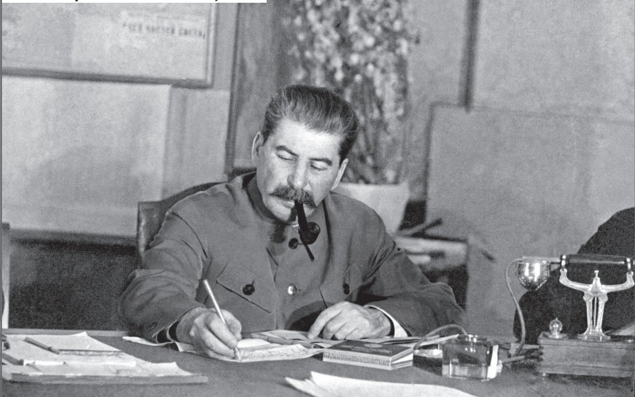
Сталин в рабочем кабинете, 1935