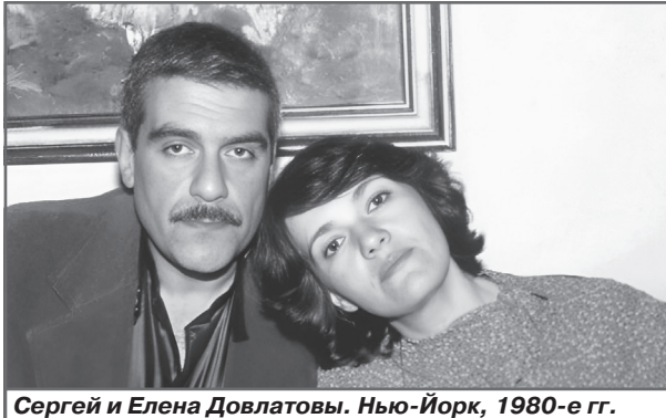
Сергей и Елена Довлатовы. Нью-Йорк, 1980-е гг.